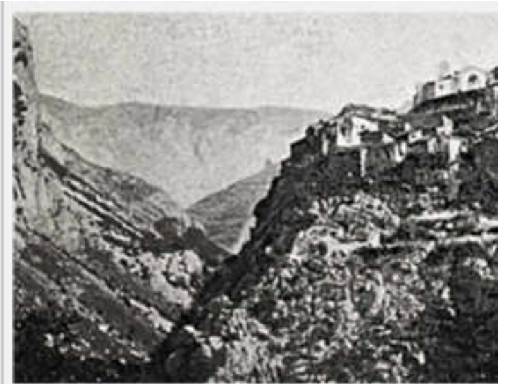
Una vecchia immagine della gola di Loreto, da una cartolina risalente agli anni 50 del Novecento.

Il ponte di Loreto consente di raggiungere Cetta, case Mauta e case Rielli, piccolissime frazioni di Triora, anticamente raggiungibili solo con una mulattiera attraversando il torrente Argentina al medievale ponte di Mauta. Le frazioncine non avrebbero meritato la spesa astronomica di circa 100 milioni di lire, tanto è stato speso nel 1958 per la costruzione di un nuovo ponte, ma la singolare morfologia dei luoghi permetteva la sperimentazione di tecnologie utili per la nascente rete autostradale italiana.